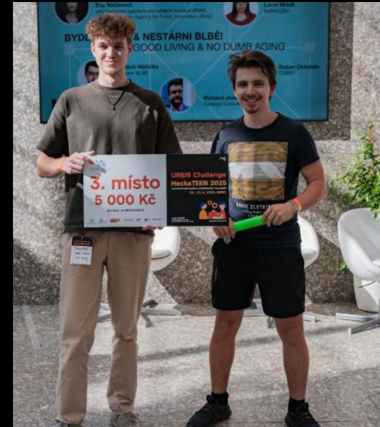
Komplexní městský smart systém