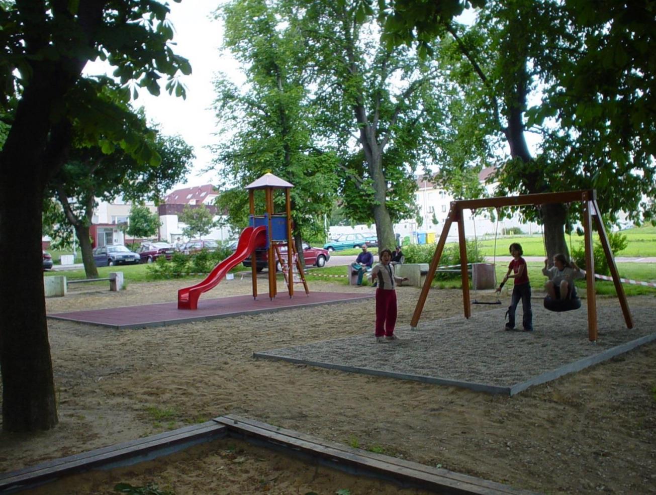
Praha 18 - Letňany