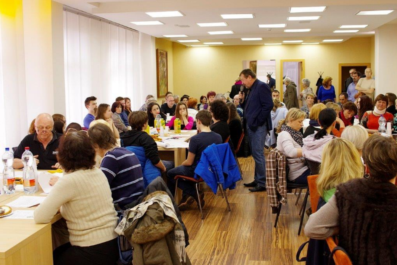
Praha 18 - Letňany (setkání s občany)