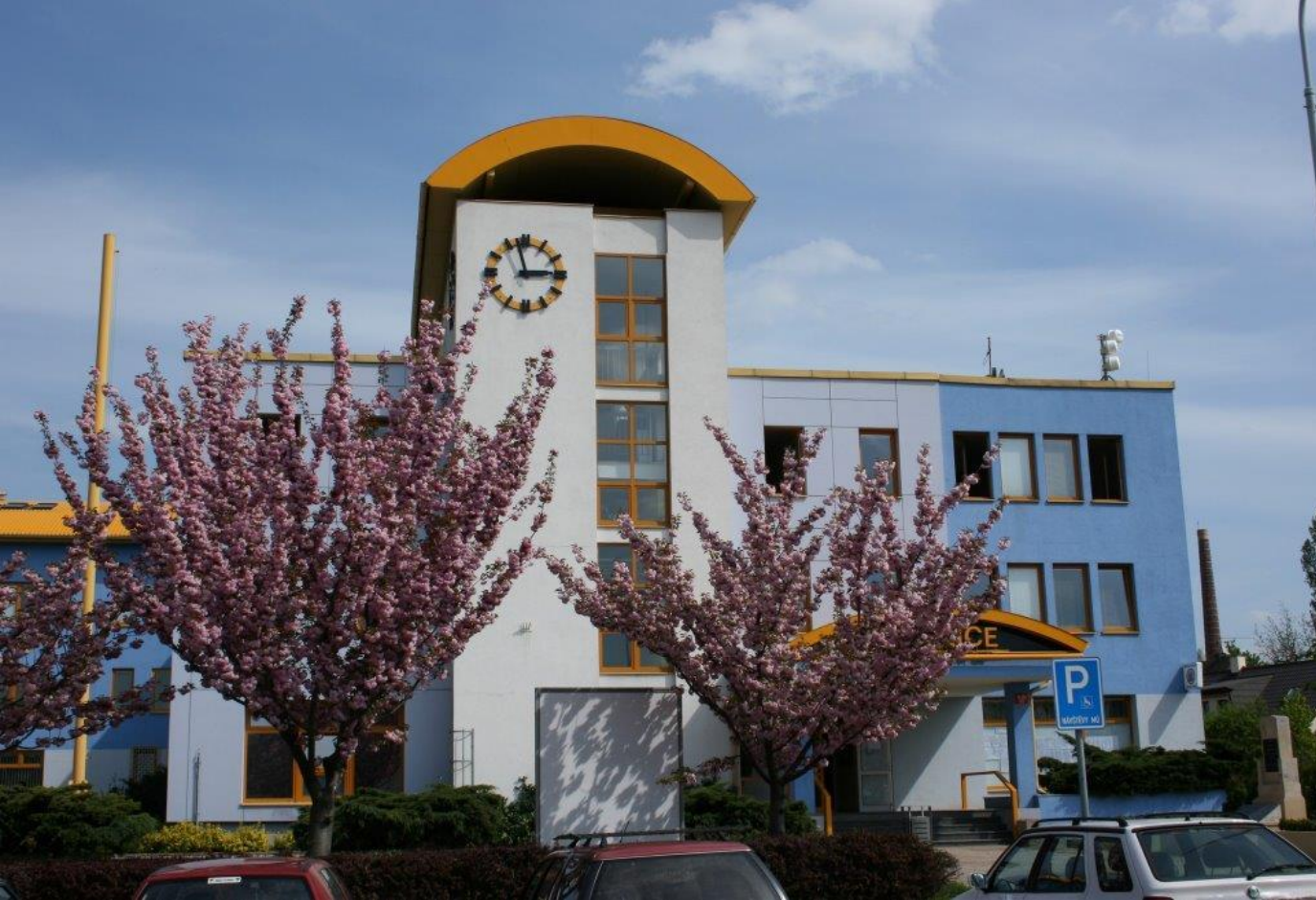
Praha 18 - Letňany (radnice MČ Praha 18)