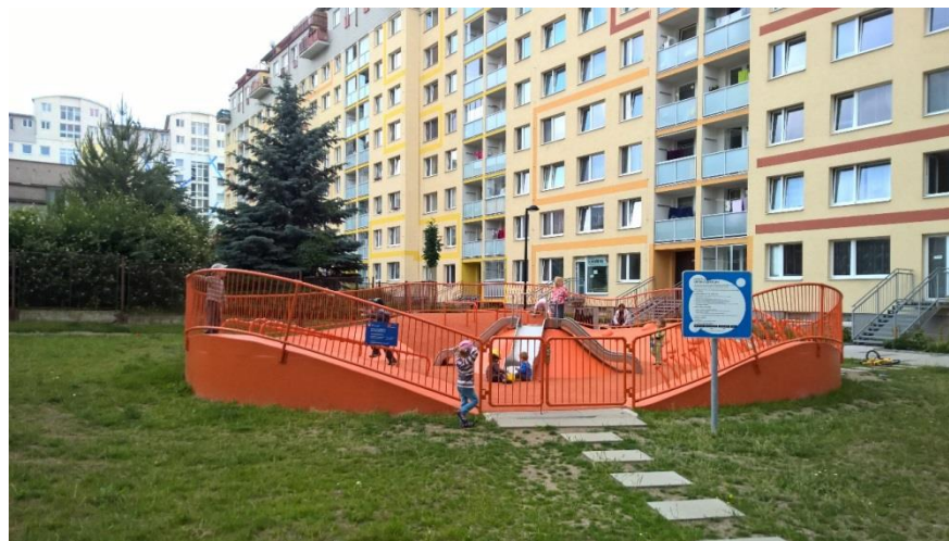
Praha 18 - Letňany (revitalizace sídliště - Letňanské lentilky)