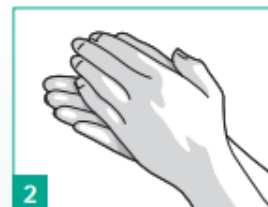
2 Třete dlaněmi o sebe.