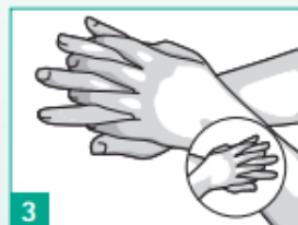
3 Pravou dlaní třete hřbet levé ruky s proloženými prsty a pak ruce vystřídejte.