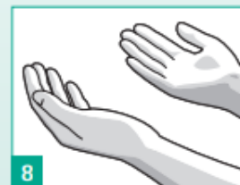
8 Po zaschnutí jsou Vaše ruce bezpečně čisté.

PRO ÚČINNOU HYGIENU RUKOU SI RUCHE DEZINFIKUJTE!