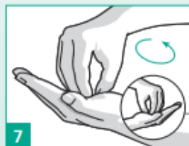
7 Krouživě třete tam a zpět sevřené špičky prstů pravé ruky v levé dlaní a naopak.