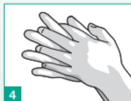
4 Třete dlan' o dlan' s proloženými prsty.