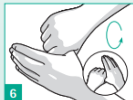
6 Krouživě třete levý palec sevřenou pravou dlaní a naopak.