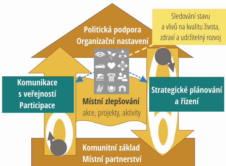
Obr. Systém místního zlepšování pro Zdravá města, obce a regiony

těchto systémových součástí. Na základě způsobu, jak je systém kvalitně nastaven a aktivně používán, je také možné poskytovat zpětnou vazbu Zdravým městům, obcím a regionům o jejich pokročilosti. Každoročně je za tímto účelem vyhodnocena interní „Liga NSZM“.