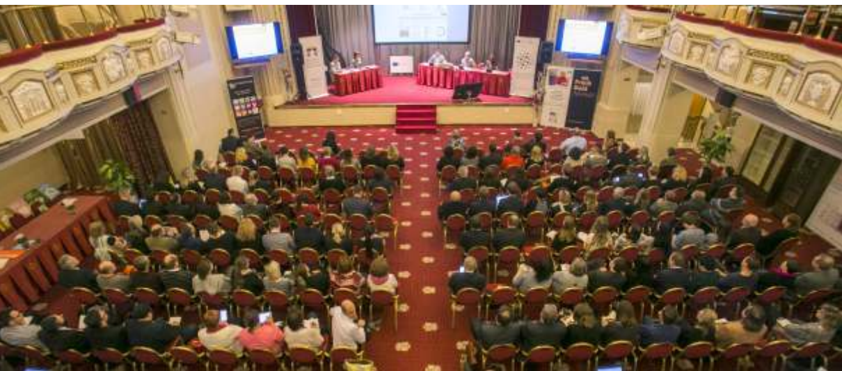
25. celostátní konference NSZM „Vyšvihněte se s námi!“: V pražském hotelu Ambassador se k tématům strategického řízení či zapojování veřejnosti společně setkala více než 260 účastníků.

Přístupů a metod řízení kvality, které jsou nejčastěji využívány organizacemi veřejné správy v České republice, je celá řada: TQM (Total Quality Management; Úplné řízení kvality), Model CAF (Common Assessment Framework; Společný hodnotící rámec), CSR (Corporate Social Responsibility; Společensky odpovědná organizace), benchmarking ad. Významnou úlohu zde mají normy ISO, zejména standard ISO 9001 s požadavky na systémy managementu kvality organizace. Tyto metodiky definují jednotné požadavky na systémy řízení kvality a tvoří tak specifickou skupinu standardů. Mohou fungovat samostatně, organizace ale mohou integrovat více metod kvality / nástrojů řízení.