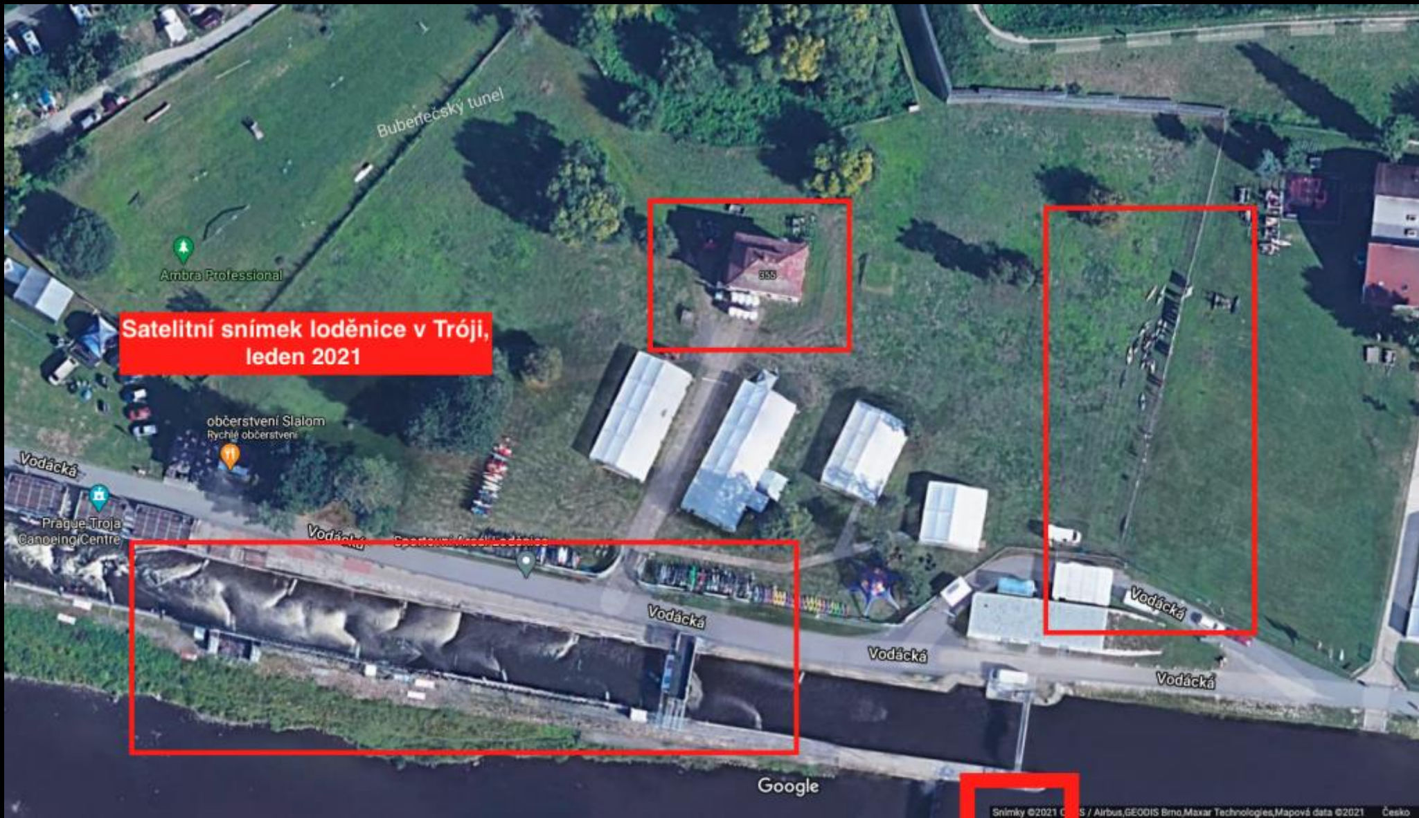
Satelitní snímek loděnice v Tróji, leden 2021