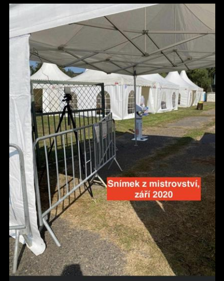
Snímek z mistrovství, září 2020