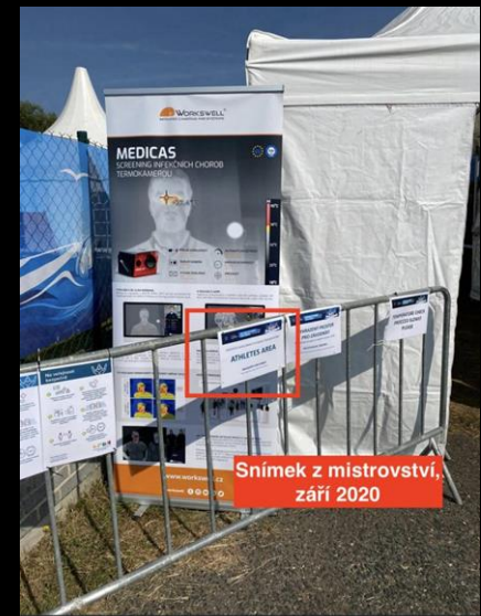
Snímek z mistrovství, září 2020