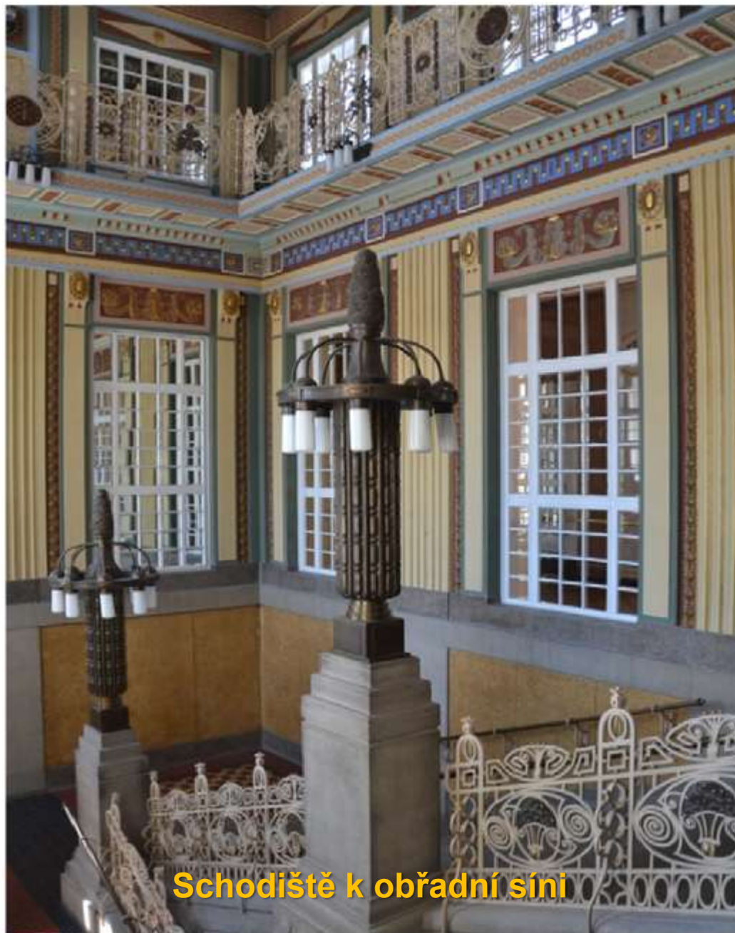
Schodiště k obřadní síni