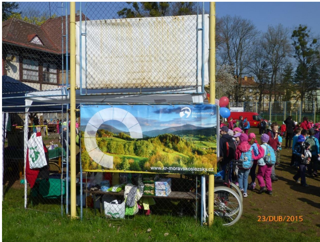
Den Země 2015 a Den zdraví a sociálních služeb 2015 (Frýdek-Místek)