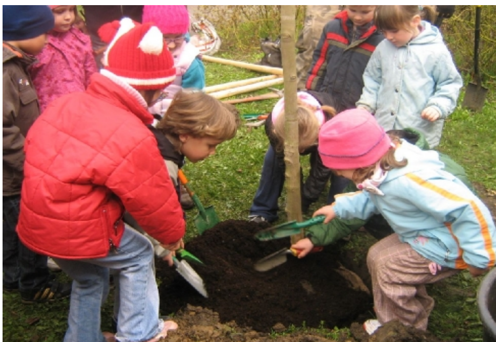
Plantation d'arbres collective pendant la campagne du Jour de la Terre dans le Quartier-Santé Praha-Libus a Pisnice