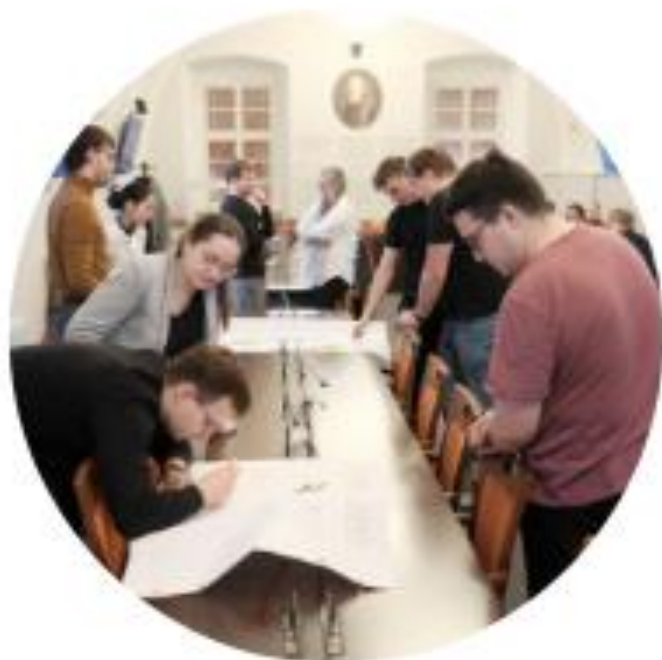
MINISTERSTVO ŠKOLSTVÍ, MLÁDEŽE A TĚLOVÝCHOVY