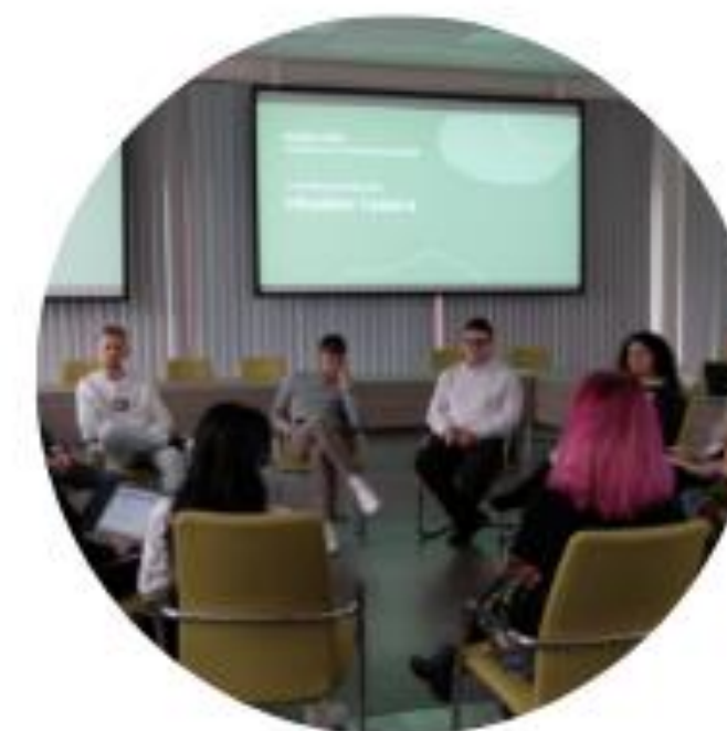
MINISTERSTVO ŽIVOTNÍHO PROSTŘEDÍ