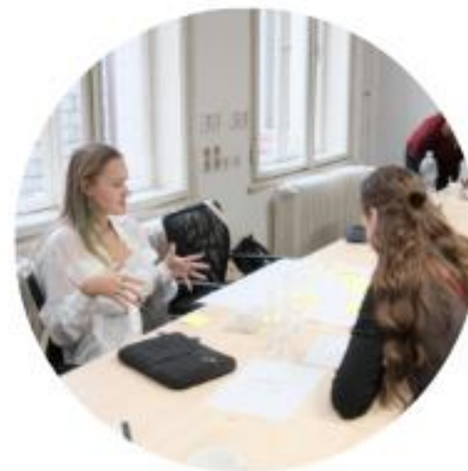
MINISTERSTVO PRO MÍSTNÍ ROZVOJ